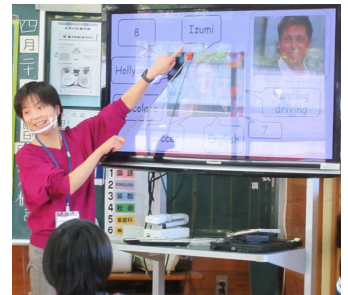
今年度初めての5・6年の外国語授業