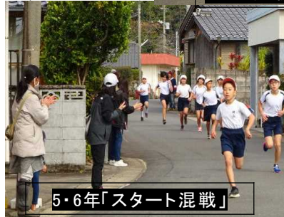
5・6年「スタート混戦」

記録を更新しました。持久力向上等、一生懸命努力してきた子供たちに拍手を送りたいと思います。