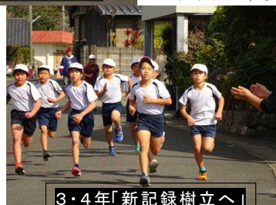
3・4年「新記録樹立へ」

くの子供たちが自己記録を更新しました。また、4年生の○○○さん、○○○さん、3年生の○○○さんが8年ぶりに大会