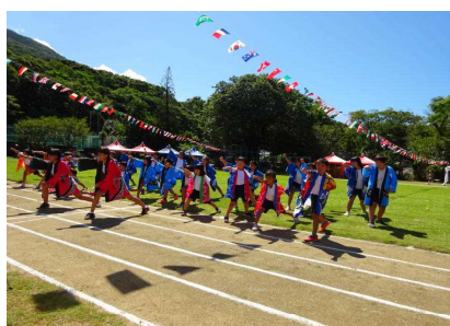
運動会での子供たちの 気迫あふれる 「栗生っ子 ソーラン」 の演技の様子