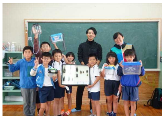
【3・4年総合「屋久島の自然と生きもの」:環境文化研修センター】 【3年社会「消防団の仕事」:栗生消防団】